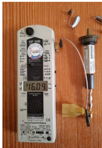
Figuur 4. HF59B Voor meting van RF velden tot 2,5 GHz met UBB27_G3 antenne. Met audio-uitgang