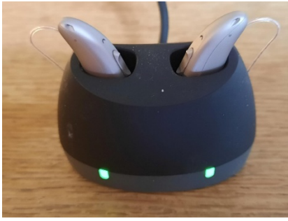
Figuur 1. Het oplaadstation van de hoorapparaten. De bluetooth straling wordt hier automatisch uitgeschakeld. Zolang de het oplaadproces actief is knipperen de groene ledjes onderaan.