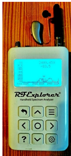
Figuur 3. RF-Explorer Voor RF spectrumanalyse tot 6,1 GHz. Veldsterkte in dBm. Voor schermdetail, zie figuur 7.