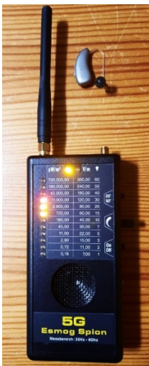
Figuur 2. 5G Esmog Spion Voor RF velddetectie op het gehoor. Ledjes geven de veldsterkte aan. Met audio-uitgang