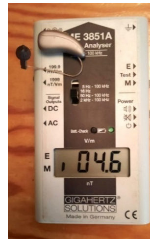
Figuur 5. ME3851A Voor meting van extreem lage (ELF) magnetische wisselvelden Met audio-uitgang NB. Aanwijzing is inclusief 2,1 nT achtergrondveld